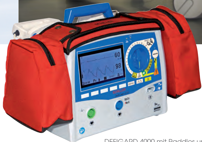
DEFIGARD 4000 mit Paddles und Taschen

Das Gerät kann mit nur einer Bewegung aus der Halterung genommen werden.