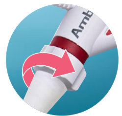
120°-Rotation nach links/rechts