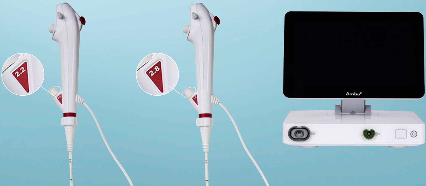
Ambu® aBox™ 2 Visualisierungs- und Prozesseinheit