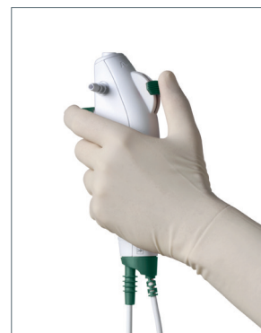
Das ergonomische und leichte Handstück bietet optimalen Halt und Griffkomfort