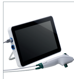
Ambu aScope 4 Broncho Regular und Ambu aView 2 Advance