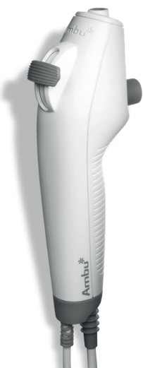
Ambu aScope 4 Broncho Slim 3,8 / 1,2 Biegewinkel: 180°/180°