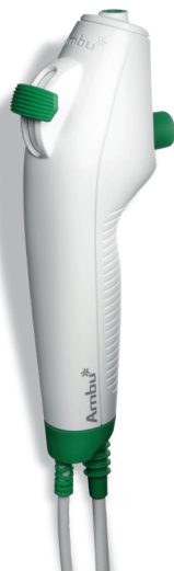
Ambu aScope 4 Broncho Regular 5,0 / 2,2 Biegewinkel: 180°/180°