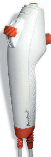
Ambu aScope 4 Broncho Large 5,8 / 2,8 Biegewinkel: 180°/160°