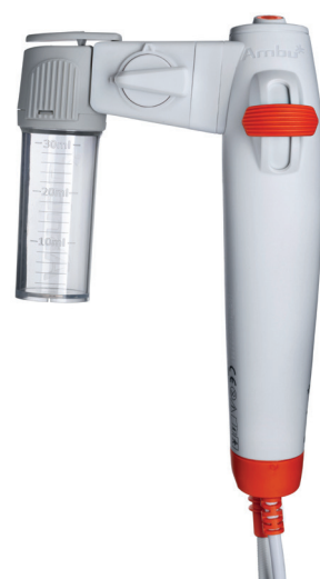
Ambu aScope BronchoSampler