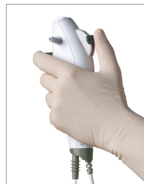
Das ergonomische und leichte Handstück bietet optimalen Halt und Griffkomfort