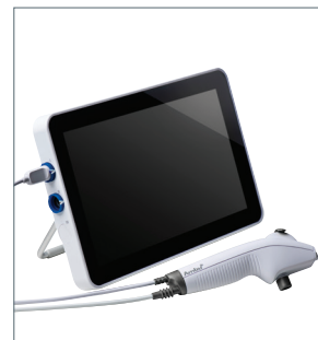
Ambu aScope 4 Broncho Slim und Ambu aView 2 Advance