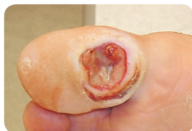
Diabetisches Fußulcus vor und nach der Behandlung mit ActiMaris® Wundspüllösung und Wundgel