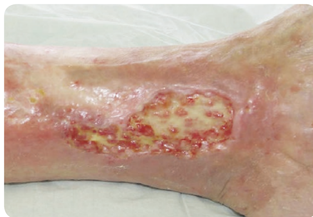
vor der Behandlung