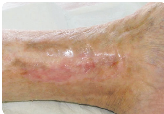
nach der Behandlung mit ActiMaris® Wundspüllösung und Wundgel