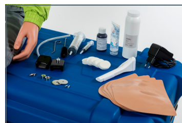
Zubehör im Lieferumfang enth.