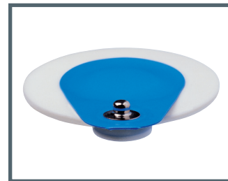
S = Druckknopf