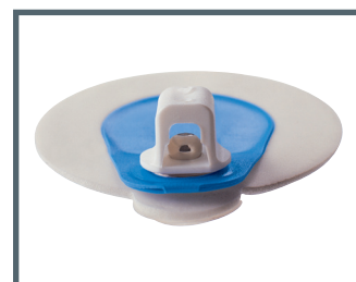
F = 3 mm Bananenstecker