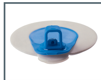
A = 4 mm Bananenstecker